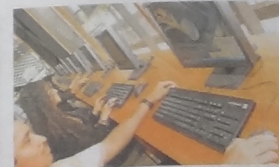
A partir de mañana los usuarios podrán disfrutar de estas computadoras con acceso a Internet.