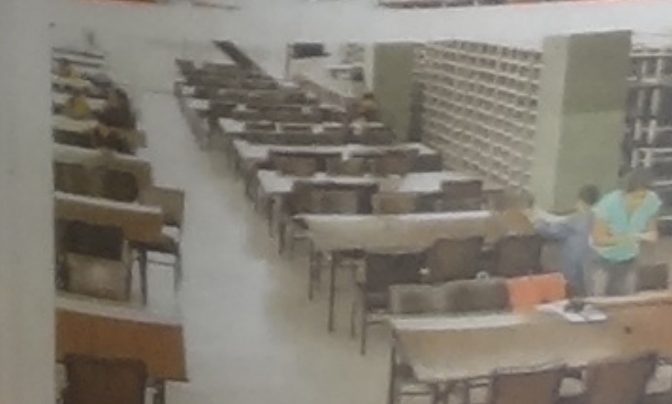
No se engañe por los puestos vacíos. En sus grandes salas siempre hay gente estudiando o leyendo.