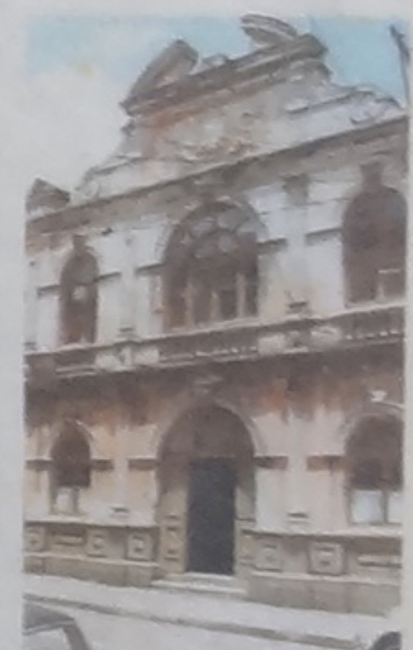
El antiguo edificio de la biblioteca.

El próximo año, el ICE cambiará toda la instalación telefónica y eléctrica con una inversión de $300 millones. También se cambiarán las luces.