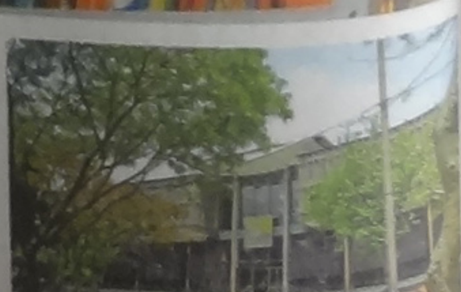
La biblioteca se trasladó en 1971 a a este edificio ubicado frente al Parque Nacional. Abelardo Fonseca.