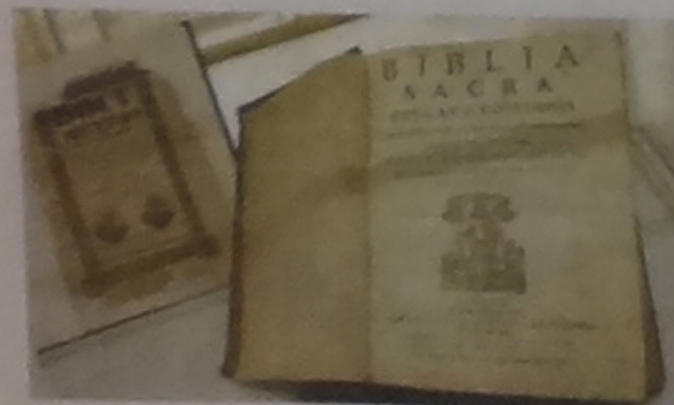
Si la visita en estos días encontrará en exhibición esta reliquia. A la derecha una Biblia de 1702.