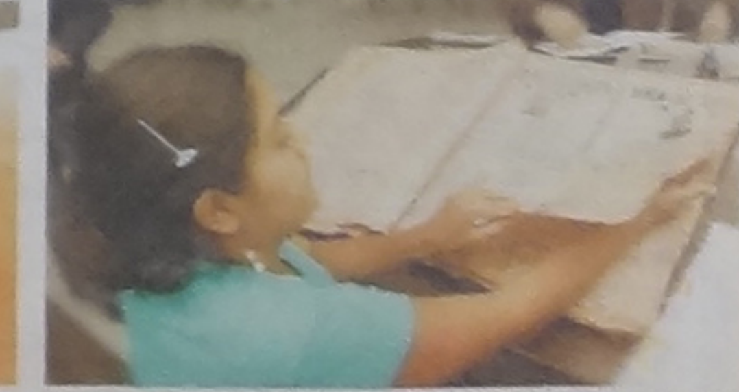
Los periódicos antiguos son de los más buscados. La biblioteca abre de lunes a viernes de 8 a.m. a 4 p.m.